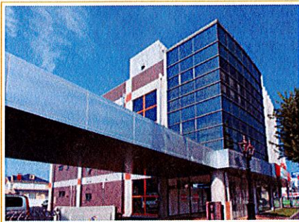
平成21年10月 東京ガスライフバル澤井株式会社設立

東京ガスライフバル相模原株式会社の経営権取得 (相模原市中央区・緑区 63,635件) 合計307,465件 (社員数73名) 合計296名