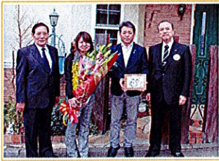
平成28年2月 東京ガス 広瀬社長を迎えて電力契約第一号のお客さま(町田市在住)と記念セレモニーを実施