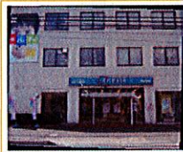
平成16年1月 エネスタ相模大野 開店