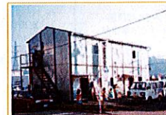
昭和62年5月 町田SC(サービスセンター)開店