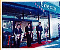
平成8年1月 エネスタみどり新社屋完成