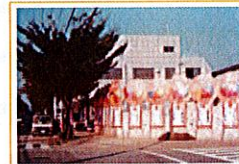
昭和62年11月 町田SC新社屋開店