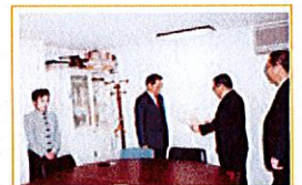
平成9年11月 優良申告法人表彰

株式会社澤井設立 町田サービスセンター 開店 資本金2,500万円 お客さま件数/51,608件 (社員数21名)