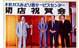
平成7年7月 みどり西SC開店